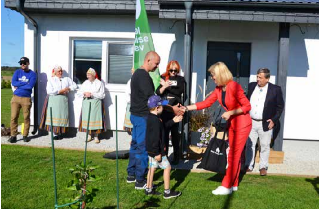
Minister Piret Hartman kingib peredele leivad.