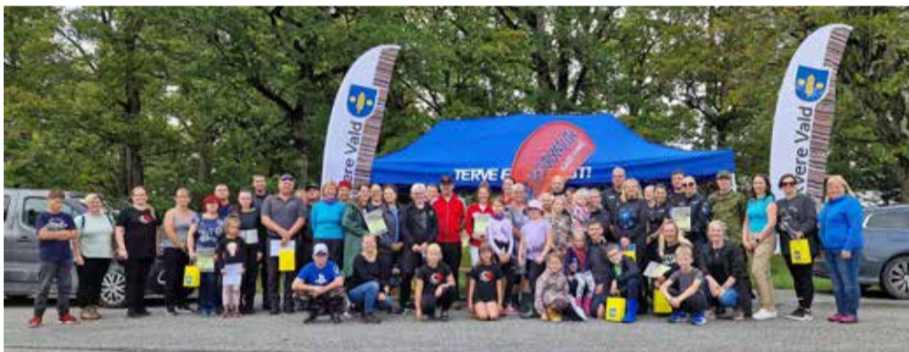
Lasila rogain 2024.