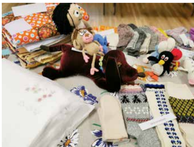
Eelmise näituse tööd.

Näitusetöid kogume 21.–29. november. Esemid saab tuua Lepna või Sõmeru raamatukokku. Lisa palun oma tööde juurde kontaktandmed, nimi ja/või telefon, e-postiaadress, koduleht või FB-leht, et huvilisel ja korraldajal oleks võimalik sinuga