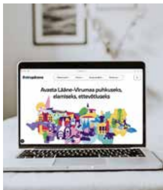
Uus Lääne-Virumaa veebivärv.

Alates 19. septembrist on avatud Lääne-Virumaa