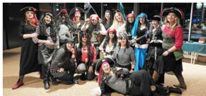
Uhtna piraadid (naiskoor).