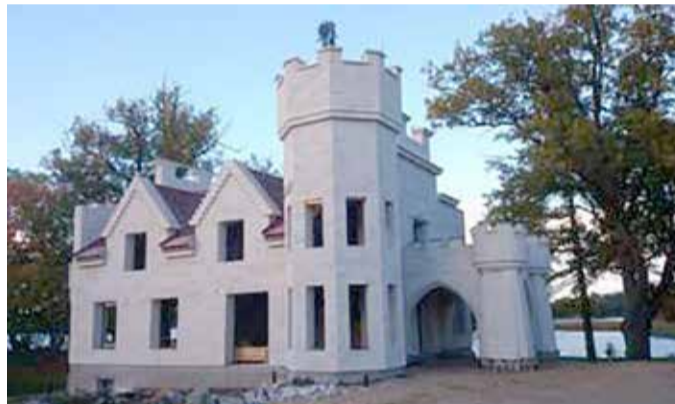
Põnev hoone Valgjärvel.

Bauroci teine tegevusvaldkond on kivimajapakkettide tarne ja montaaž JÄMERÄ kaubamärgi all Soomes ja Eestis. Poorbetoontoodetel põhinev JÄMERÄ on funktsionaalne ja energiasäästlik põhjamaisesse kliimasse mõeldud terviklik kivimaja kontseptsioon, mis