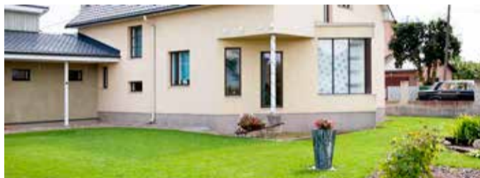
Üks esimestest AEROCI-majadest.

on hinnatud oma energia-tõhususe ning tervisliku sisekliima poolest. JÄMERÄ on Soome vanim ja enim müüdud kivimaja aastast 1974, mille müügi ja paigaldusega Soomes tegeleb Bauroc AS tütarfirma Jämerä Kivitalot Oy. Eestis müüb JÄMERÄ kivimaju frantsiisilepingu alusel Stone Energy OÜ.