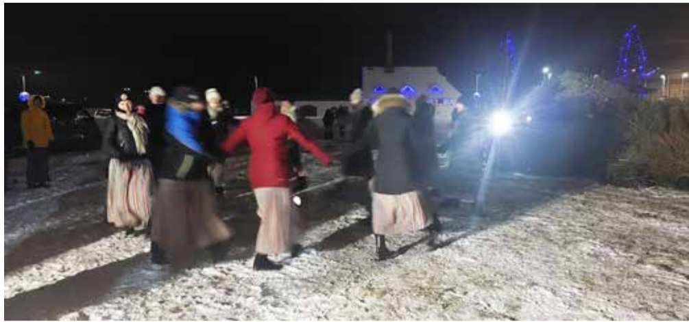
Sõmeru Sõsarad tantsuhoos.

Kuuske põletamine 6. jaanuaril on traditsioon, mida järgivad paljud riigid ja kogukonnad, sealhulgas Eestis. See sümboliseerib jõulupühade perioodi lõppu ja vana aastaga hüvasti jätmist. Sõmerul oli kuuske põletamine 6. jaanuaril. Tantsupeo aastale kohaselt astus üles naisrahvatantsurühm Sõmeru Sõsarad, kellega koos sai üks lõbus perekonna valss ühiselt tantsitud. Lapsi lõbustasid Minni ja Kloun vahvate mängude-