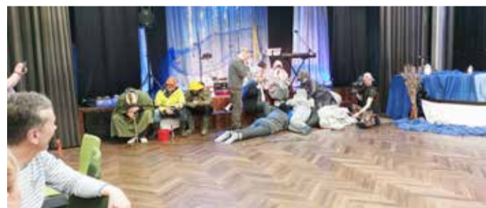
Uhtna Mandoliiniorkester hülgeteemalist näitemängu esitamas.